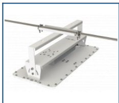
Кронштейн на трос Diora Quadro (комплект)